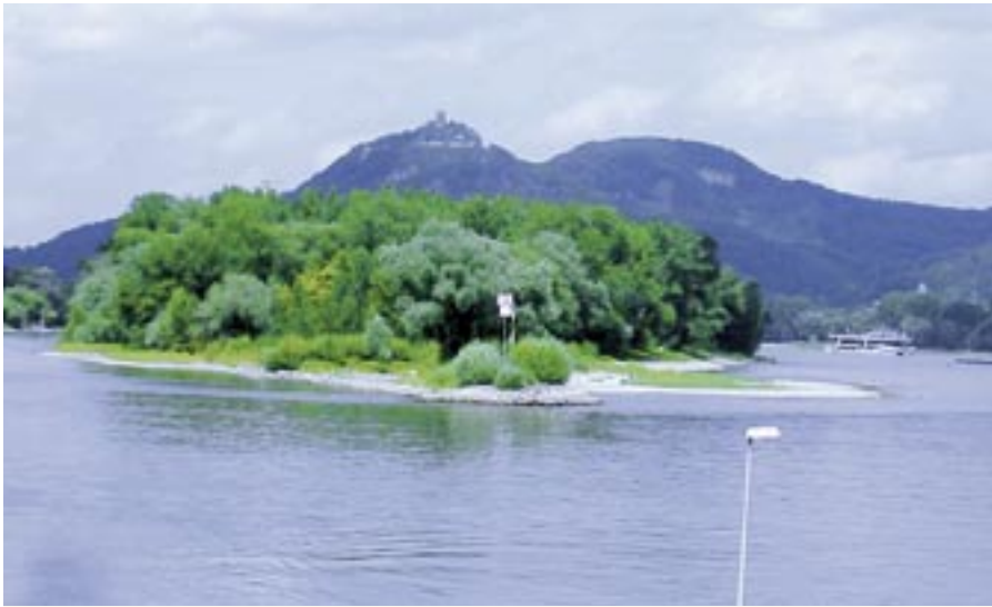
Oben: Der Drachenfels und ein Blick auf die „Augenbrauen-Formation“ im Fluss. Mitte: Die Karte von Bad Honnef verdeutlicht die besonderen Berg und Flussformationen. Unten links: Das Grab Adenauers – wieder hat er den Drachenfels im Rücken. Unten rechts: Adenauer und De Gaulle – eine legendäre deutsch-französische Freundschaft.